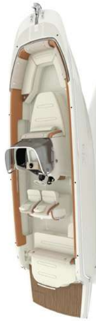
Configurazione "Leisure" estesa / Extended "Leisure" configuration