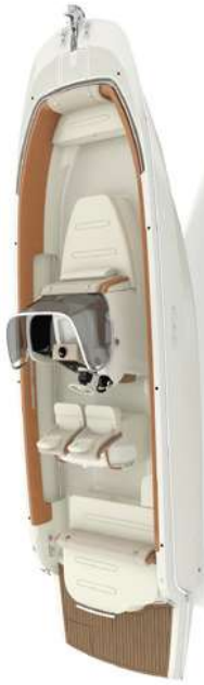
Configurazione "Leisure" compatta / Compact "Leisure" configuration